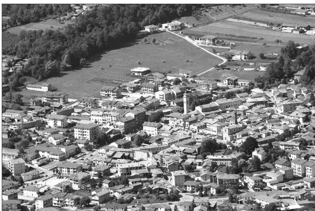
Significativi i riflessi sul territorio con l'approvazione della variante al PRGC

Con l'approvazione di tale strumento urbanistico è però subentrata anche una problematica inaspettata poiché è stato "stralciato" l'intero articolo riguardante la destinazione commerciale in quanto il piano stesso dovrà essere "riadeguato" ad una nuova deliberazione del Consiglio Regionale risalente al marzo del 2006 per la quale sarà ora necessaria la predisposizione di ulteriori elaborati da riapprovare in Consiglio Comunale apportando di seguito una nuova "variante non sostanziale" ai sensi dell'ex art. 17 della L.R. n° 56/77 smi., che consentirà di "riottenere" la normativa in tale ambito con l'introduzione di alcune ulteriori modifiche di destinazione zonale che nel frattempo sono emerse. Servi-